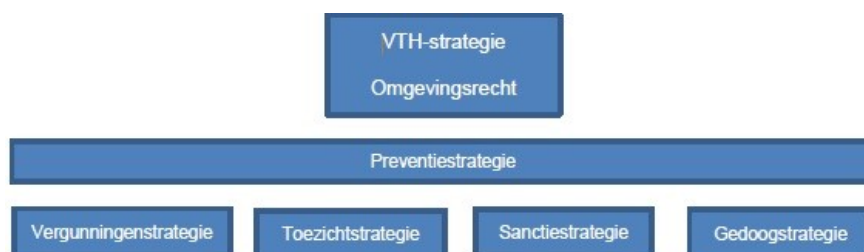
Figuur 3: onderlinge verhouding strategieën

De sanctiestrategie en gedoogstrategie maken onderdeel uit van de Landelijke Handhavingstrategie (LHS). Ondertussen zijn er ontwikkelingen gaande, zoals het opleveren van een geactualiseerde (LHS) en een Landelijke Vergunningenstrategie. De uitkomsten hiervan worden betrokken bij de doorontwikkeling van deze U&H-strategie.