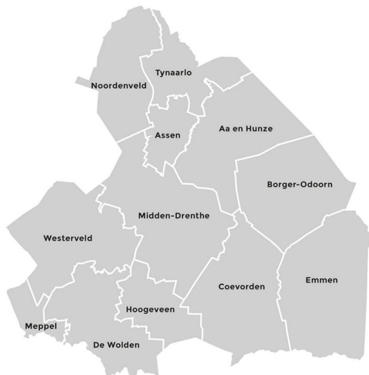
Figuur 2: Overzicht van het werkgebied van de RUD Drenthe

Drenthe is geweldig! Het prachtige landschap en de rijke geschiedenis wordt door veel mensen enorm gewaardeerd. In Drenthe is er nog rust, het Dwingelderveld is in 2020 niet voor niets verkozen tot het stilste gebied van Nederland. Naast rust zijn er in Drenthe ook een aantal bijzondere bedrijven te vinden zoals: Astron in Dwingeloo, Wildlands Adventure Zoo in Emmen en het TT-Circuit in Assen. Meer dan 95% van de het Drentse bedrijfsleven behoort tot het MKB. Binnen de overige bedrijven is agrarische sector het sterkst vertegenwoordigd, gevolgd door de recreatieve sector. Zware industrie bevindt zich op het Getec Park in Emmen. Hier hebben zich onder andere bedrijfstakken van DSM en Teijn Aramid gevestigd.