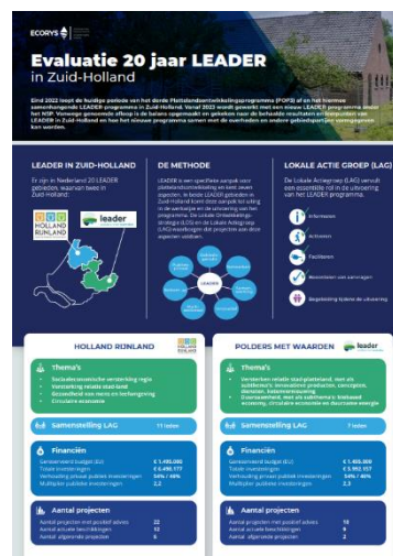
Figuur 3 Voorbeeld infographic