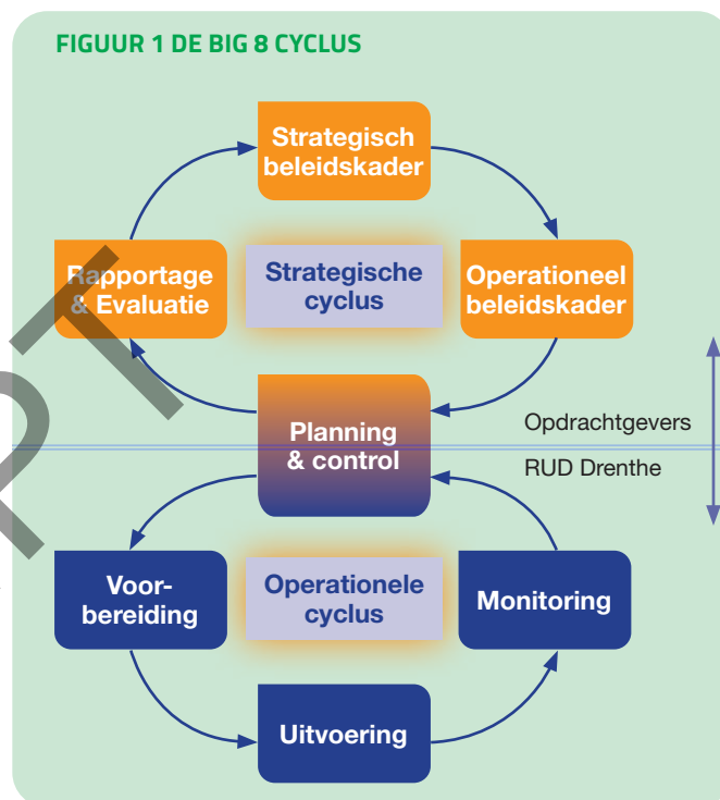
FIGUUR 1 DE BIG 8 CYCLUS

De uitwisseling van gegevens tussen de systemen van opdrachtgevers en RUD Drenthe, wordt nu nog handmatig gedaan. We verwachten meer efficiëntie te realiseren door in de toekomst gebruik te maken van robotisering. Bij robotisering wordt een softwarepakket ingezet om repeterende handelingen van medewerkers te automatiseren. Vorig jaar is een pilot gestart om te onderzoeken hoe met de robot, geautomatiseerd dossiers die worden aangeleverd door de gemeenten ingelezen kunnen worden.